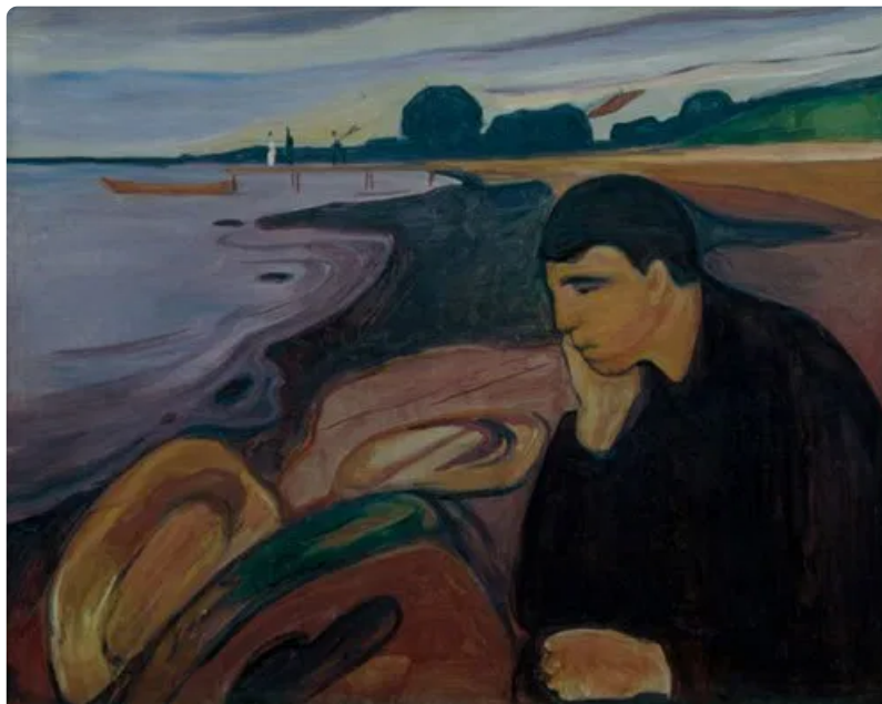
Melancholia, de Edvard Munch /

Desde que a Organização Mundial de Saúde (OMS) declarou, no dia 11 de março de 2020, a pandemia da Covid-19, cada região do planeta está buscando um modo de lidar com essa realidade e a saída mais importante, e que impõe uma transformação radical no nosso cotidiano, é o afastamento social ampliado que, por sua vez, tem levado a população ao adoecimento mental em massa e ganha os contornos do poderá vir a ser a quarta onda da Covid-19.