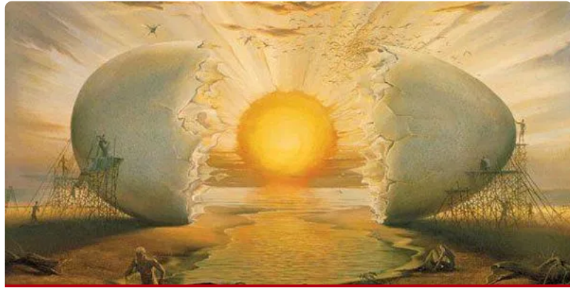
Pintura de Vladimir Kush

que um sujeito pode ganhar ao se despir assim de sua singularidade?