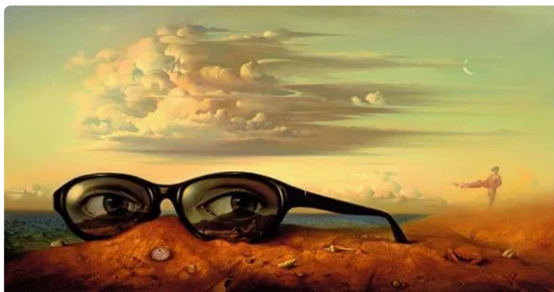
Pintura de Vladimir Kush

modificações se devem, fundamentalmente, às frequentes mudanças que vêm ocorrendo no mundo — muitas delas impulsionadas pela própria psicanálise.